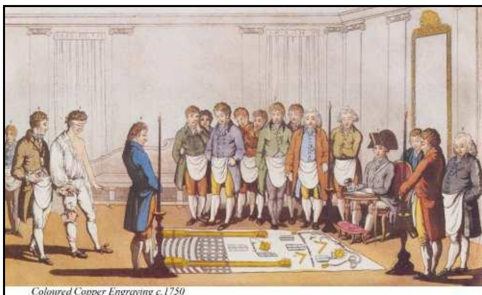
Coloured Copper Engraving c.1750

l'idéal cosmopolitique et laïque qui sera celui des Lumières, puis de la République.