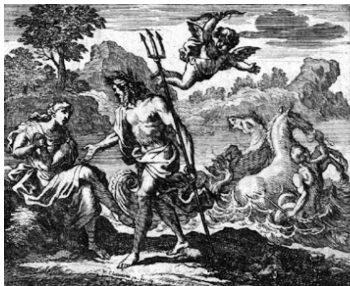
(Ci-contre, Neptune, gravure de François Chauveau, XVII e siècle)

Au contraire de *Perk w unos, qui était un personnage par essence central, *Neptonos était périphérique, ce qui ne veut pas dire inférieur, loin de là. D'ailleurs, c'est lui qui nous intéresse le plus aujourd'hui ! Il était donc rattaché au Ciel et aux Enfers ; or ceux-ci étaient maritimes. Il était donc un dieu aquatique, mais vivait également dans les forêts profondes et les montagnes, lesquelles avaient bien un caractère périphérique, tandis que les villages, le domaine des hommes, étaient considérés comme centraux. Il incarnait la sauvagerie, l'antithèse de la civilisation.